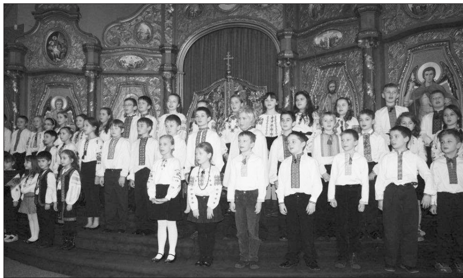
Виступають учні Рідної Школи при парафії Св. Юрія Переможця