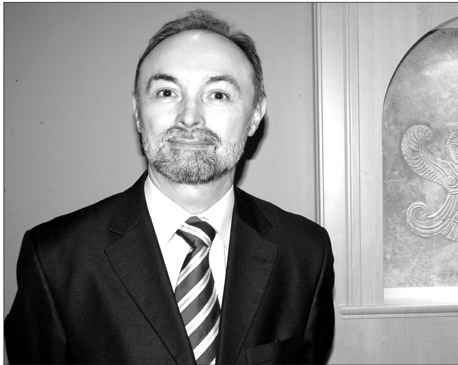
Виконуючий обов'язки голови Організації Українських Націоналістів та голови Правління Фондації ім. Олега Ольжича Микола Яковина

Був радником прем'єр-міністра В. Ющенка, обирався народним депутатом України V скликання від Блоку “Наша Україна” і заступником голови парламентського Комітету у закордонних справах. В уряді Юлії Тимошенко працював заступником міністра культури і туризму.