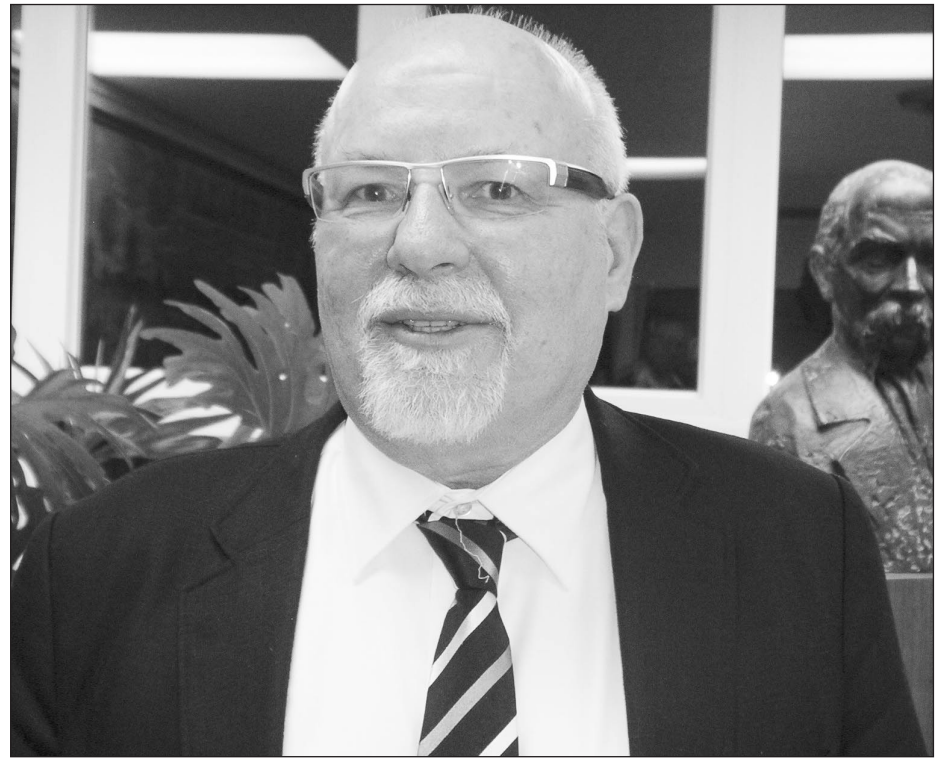
Проф. Франк Сисин

О. Зубрицький залишив нащадкам більше 360 наукових праць – серед них 220 газетних дописів, що сьогодні є неоціненним джерелом для дослідників минулого. Його цікавило все – господарські справи мешканців навколишніх сіл, складна соціальна структура, що різнилася від села до села, земельна власність – отець зібрав 220 документів, найстаріші з яких сягають XVII ст. Писав він і про поточні події, як то епідемію холери чи розповсюдження тютюну. Надзвичайно цінував усну та матеріальну культуру селян: збирав народні пісні, залишив чудові рисунки будов, одягу. Також займався історією духовенства та збирав апокрифи XVII-XVIII ст. Отець Зубрицький був членом НТШ і вступав у творчу полеміку із Франком щодо мети та напрямку роботи Товариства. Завдяки йому була організована до Мшанця етнографічна експедиція НТШ, де було записано безліч матеріалів та зроблено близько 400 знімків. Отець Зубрицький також докладав немало зусиль, щоб зберегти та показати світові шедеври народного мистецтва.